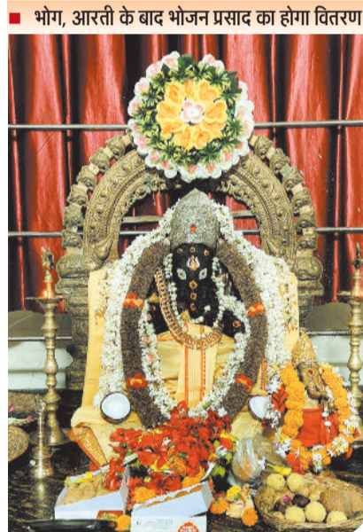
भोग, आरती के बाद भोजन प्रसाद का होगा वितरण

बिलासपुर। श्री सुमुख गणेश मंदिर रेलवे में रविवार 26 अप्रैल को एक विशेष कार्यक्रम आयोजित किया गया है। इसमें सुबह साढ़े 10 से साढ़े 12 बजे तक विष्णु व ललिता सहस्रनाम का पाठ मंदिर के पंडितों व भक्तजनों द्वारा किया जाएगा। इसके बाद सिद्धि विनायक गणेश भगवान की भोग आरती की जाएगी। दोपहर साढ़े 12 से साढ़े 1 बजे तक भोजन प्रसाद का वितरण होगा। इसमें सैकड़ों लोग प्रसाद ग्रहण करेंगे। ज्ञात हो कि यह आयोजन पर्येक माह के अंतिम रविवार को किया जाता है।