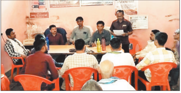
पंचायती राज दिवस पर उपस्थित पंचायत प्रतिनिधि।

बैठक की शुरुआत राष्ट्रपिता महात्मा गांधी के छायाचित्र के समक्ष श्रीफल एवं पुष्प अर्पित कर की गई। इसके पश्चात आत्मनिर्भर ग्राम पंचायत, स्वच्छता, मोर गांव मोर पानी अभियान, बाल संरक्षण, पेयजल संकट और सुशासन तिहार शिबिर की तैयारियों जैसे महत्वपूर्ण विषयों पर गंभीरता से विचार-विमर्श हुआ। ग्राम सभा में विशेष रूप से गर्मी के मौसम में पेयजल