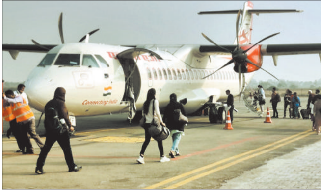
■ 1 मई को हवाई सुविधा जन संघर्ष समिति श्रमदान कर रन वे विस्तार का कार्य करेगी

रनवे की लंबाई कम होने के कारण बिलासा एयरपोर्ट को कमतर आंका जाता है, जबकि इसके विपरीत अंबिकापुर और जगदलपुर एयरपोर्ट के रन वे की लंबाई ज्यादा है। हवाई सुविधा जन संघर्ष समिति ने हवाई सुविधा विस्तार की सबसे बड़ी बाधा को जल्द से जल्द दूर करने की बात कही है। बिलासा देवी कैंवेंट एयरपोर्ट के रनवे की लंबाई वर्तमान 1490 मीटर से बढ़कर काम से कम 2200 मीटर किया जाना है। यह रन वे अंबिकापुर एयरपोर्ट के रनवे 1920 मीटर और जगदलपुर एयरपोर्ट के रनवे 1707 मीटर से भी छोटा है। हवाई सुविधा जन संघर्ष समिति ने कहा कि बिलासा एयरपोर्ट के रनवे की लंबाई कम होने का मुख्य कारण जमीन की उपलब्ध नहीं होना है, लेकिन अब यह दुविधा भी खत्म हो चुकी है।