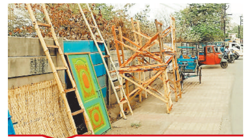
शनिवरी बाजार की ओर जाने वाली सड़क पर व्यापारियों का अवैध कब्जा।

लू का खतरा, रात 8 बजे तक चल रही गर्म हवा